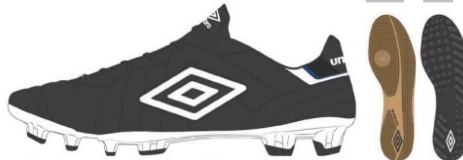
FZ9 Black/White/TW Royal