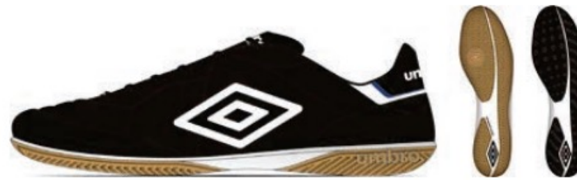
FZ9 Black/White/TW Royal