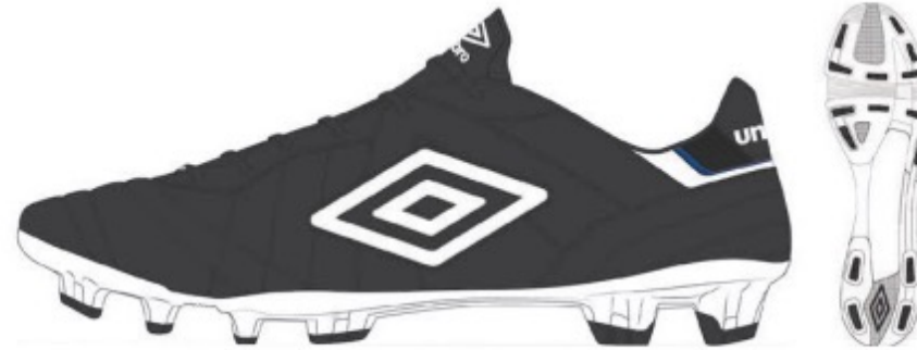
FZ9 Black/White/TW Royal