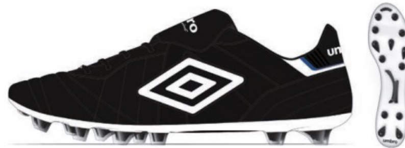
FZ9 Black/White/TW Royal